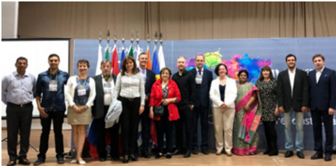
IV Congresso Internacional do Unis (22 a 27/04/2018)