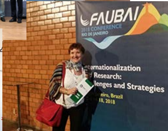
Faubai 2018 (14 a 18/04)