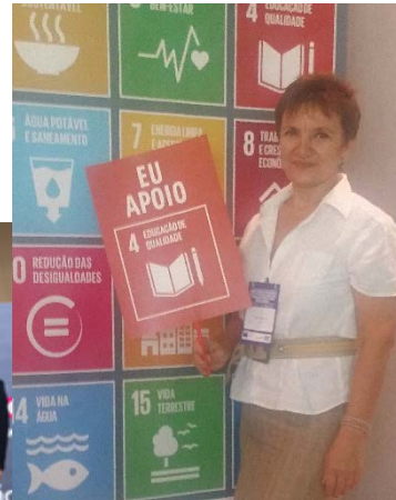
Seminário Avanços e Perspectivas da Agenda 2030 e as Prioridades Futuras da União Europeia no Brasil (06 e 07/06/2017)