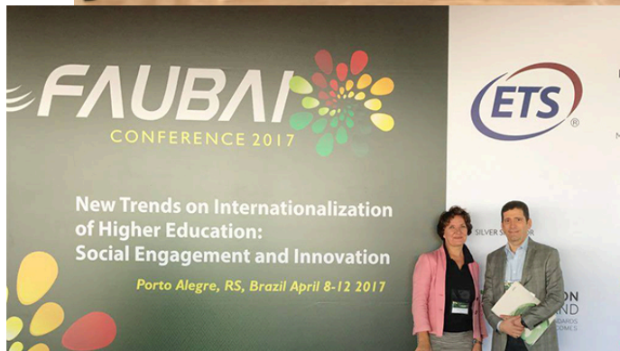
Faubai 2017 (08 a 12/04)