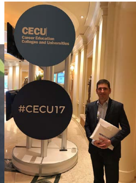
Cecu Annual Convention & Exposition (06 a 08/06/2017)